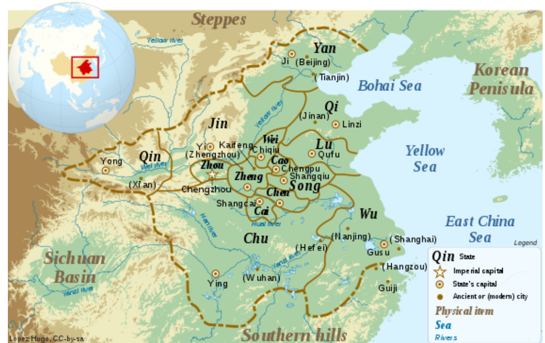
Chinese plain in the late Spring and Autumn period (5th century BC)