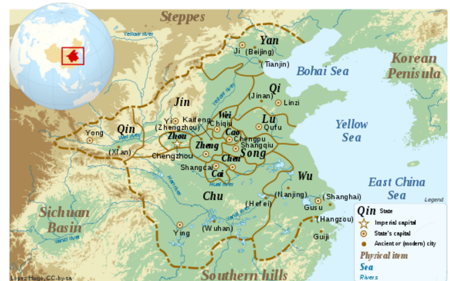
Chinese plain in the late Spring and Autumn period (5th century BC)

Le premier empereur Qin Shi Huangdi décréta un autodafé des classiques confucéens qui furent interdits et brûlés. Heureusement cinq des six classiques parvinrent à échapper au feu. Seul le « livre de la Musique » fut perdu à tout jamais. Il faudra attendre l'empereur Wudi de la dynastie des Han pour voir le Confucianisme élevé au rang d'enseignement officiel pour toute la Chine.