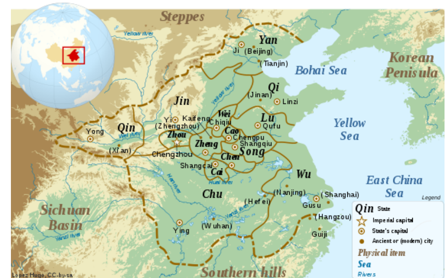
Chinese plain in the late Spring and Autumn period (5th century BC)

Durant ces années d'errance, les anciens aristocrates du pays des Lu étaient décédés, laissant le pouvoir à une nouvelle génération dont plusieurs membres étaient des élèves de Confucius. Ils insistèrent auprès du roi afin de ramener Confucius dans son pays natal. Confucius avait alors 68 ans.