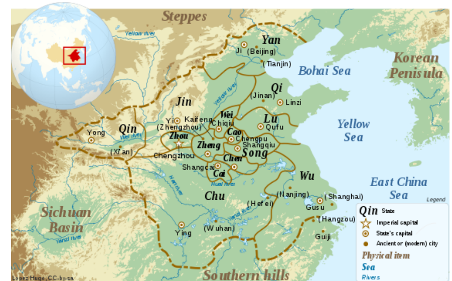
Chinese plain in the late Spring and Autumn period (5th century BC)

Rentré chez lui il consacra le reste de son existence au classement des documents anciens ainsi qu'à l'enseignement. Au soir de sa vie il travailla à corriger et ordonner les six Canons Classiques en remplaçant le faux par le vrai, tout en supprimant le superflu pour garder l'essentiel afin que ces ouvrages deviennent parfait dans son esprit.