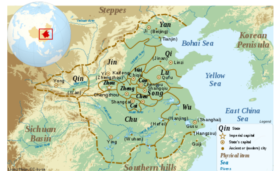
Chinese plain in the late Spring and Autumn period (5th century BC)

Confucius partit pour un périple de 14 ans accompagné de ses disciples. Il essaya de convaincre les souverains des états visités du bienfondé de son enseignement et espérait y obtenir un poste dans leur gouvernement pour y établir l'état parfait dont il rêvait. Il ne fut pas bien accueilli et essuya rebuffade ou indifférence. Un jour il fut même traité de « chien perdu » ce à quoi il répondit : « cela doit être vrai ». (Sima Qian : mémoires historiques)