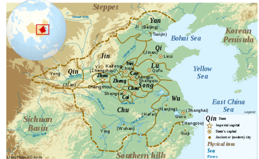
Chinese plain in the late Spring and Autumn period (5th century BC)

Confucius essaya d'endiguer le pouvoir de ces aristocrates, ce qui entraîna une lutte interne, dont le souverain voisin des Qi profita. Il envoya un cadeau au chef de l'administration : 80 belles danseuses dont les charmes finirent par paralyser tout le fonctionnement de l'état. Confucius était dégoûté par cette situation, il décida d'abandonner le gouvernement de l'état et décida de quitter le royaume. Il avait 55 ans.